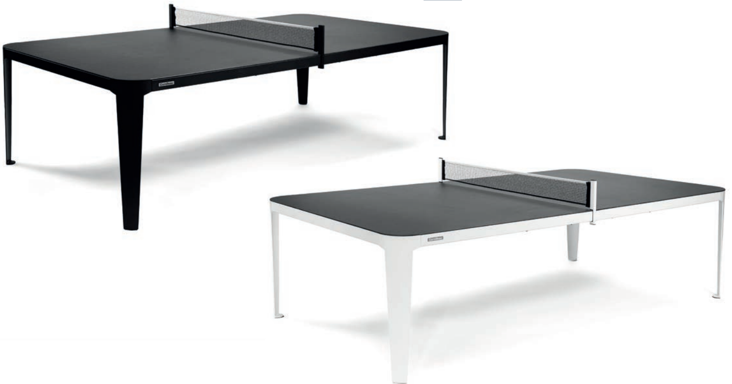
TABLE PING HYPHEN IN&OUTDOOR